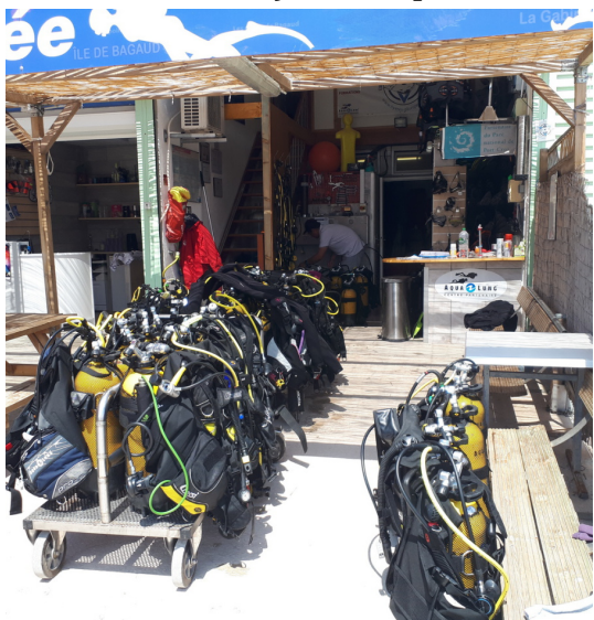
Le local et un des bateaux

Vous pourrez mettre en pratique ce que vous avez appris durant l'année. Du nitrox (du Nx32 au Nx75) est disponible sur réservation (en supplément).